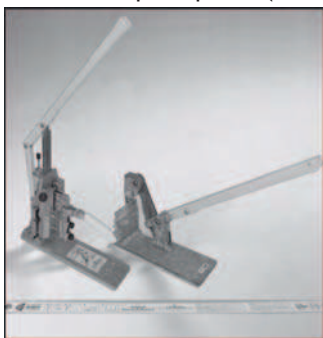
Figure 1 Grugeoir plinthes Type 1001 N°. d'art. 1001 10

Grugeoir plinthes: par entailles pour la découpe d'angle extérieurs et intérieurs Cisaille à bord Art.- N°. d'art. 1001 10 Ciseaux à découper les plinthes (Art. 1012 000) - pour une découpe de profilés